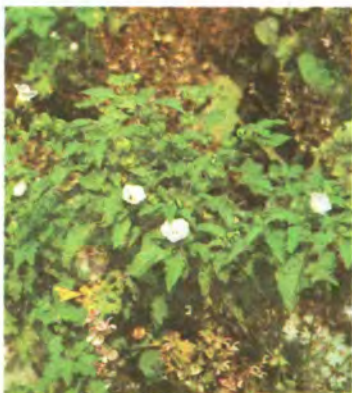
718. Нікандра марунковидна.